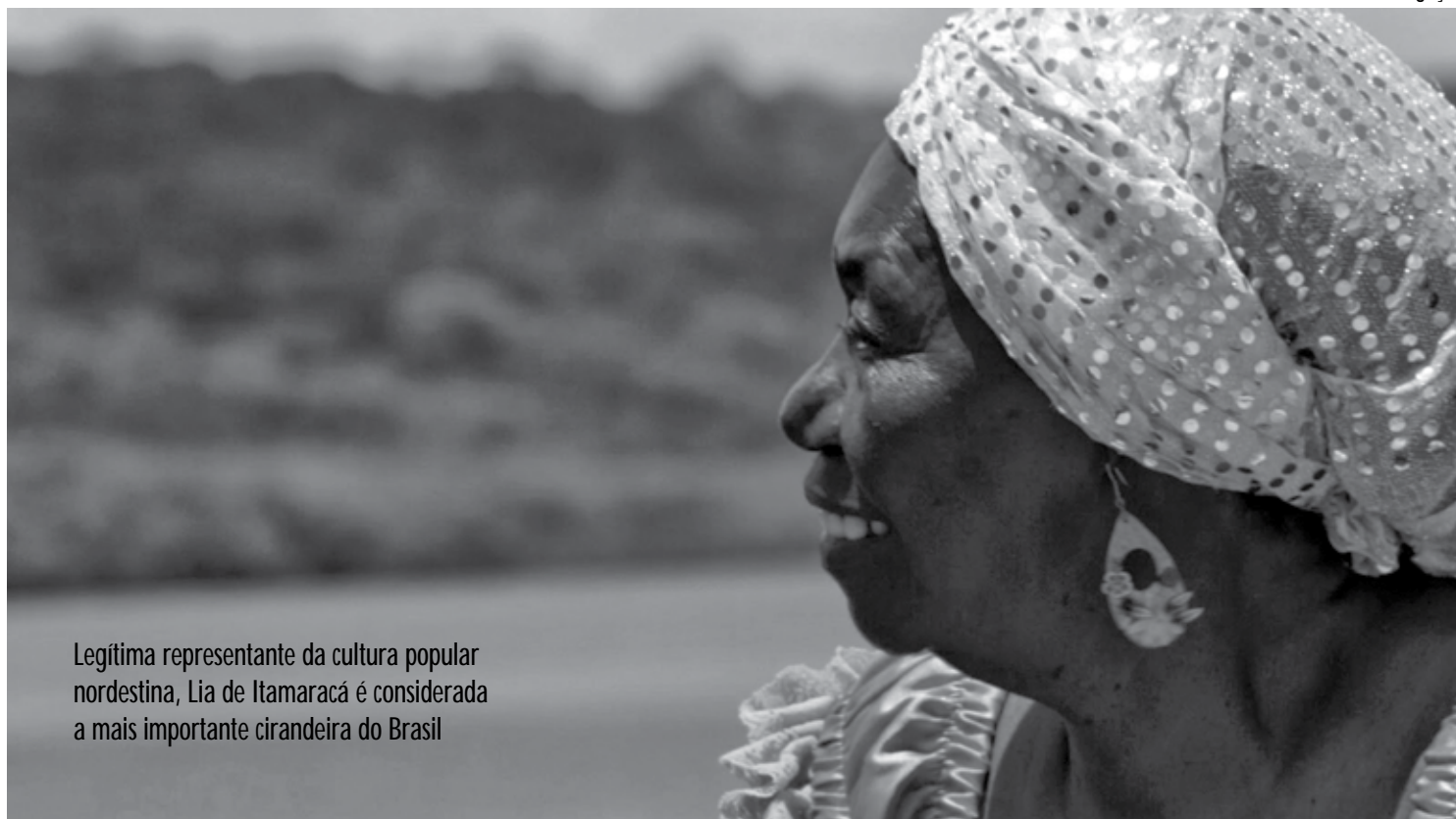
Legítima representante da cultura popular nordestina, Lia de Itamaracá é considerada a mais importante cirandeira do Brasil