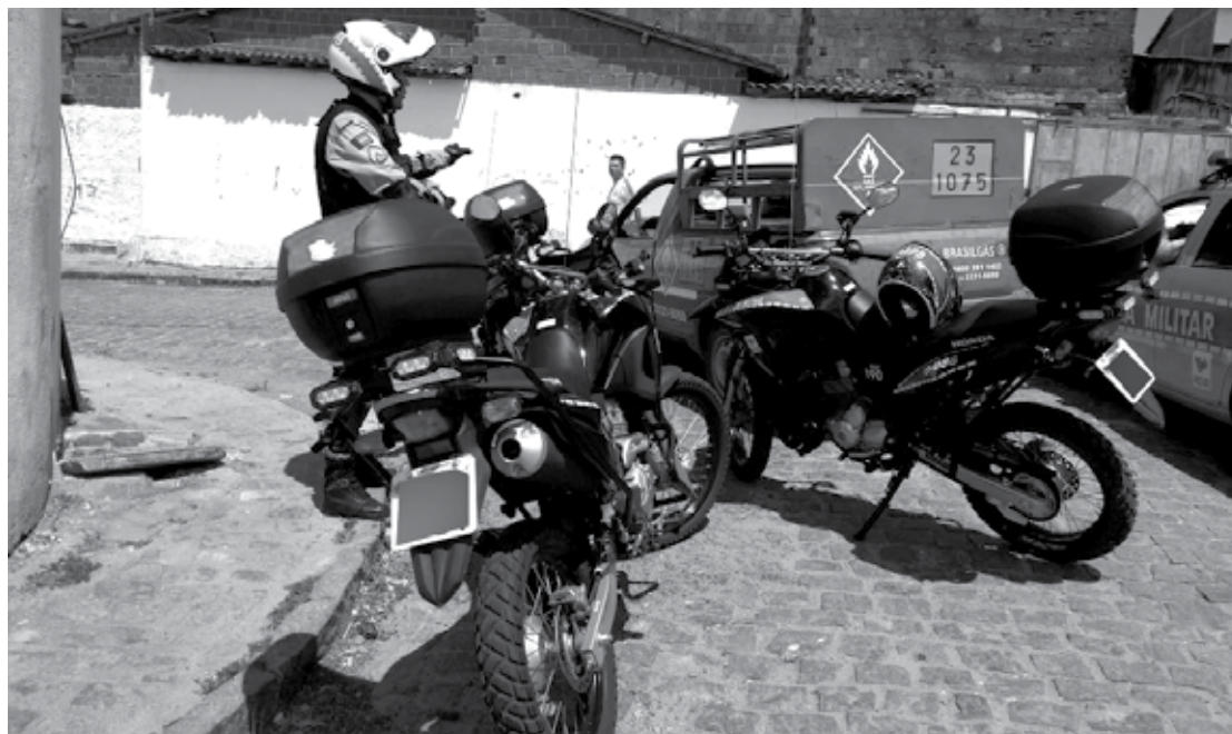
Policiais da Rotam trocaram tiros com dois suspeitos e recuperaram uma moto que havia sido roubada na sexta-feira

Após a abordagem, os policiais encontraram a arma, uma pistola, constataram que um dos dois suspeitos era menor de idade, e que a motocicleta havia sido roubada na sexta-feira pela dupla. Ainda