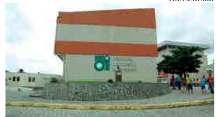
O aparelho Pet Scan será instalado no Hospital Napoleão Laureano

“Foi uma luta de quase dois anos para conseguir este grande sonho do Hospital Napoleão Laureano, de ter um equipamento desta importância. Será o primeiro hospital na Paraíba, que atende pelo SUS,