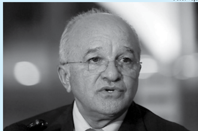
Melo e seus ex-auxiliares são acusados de desvio de R$ 50 milhões da saúde