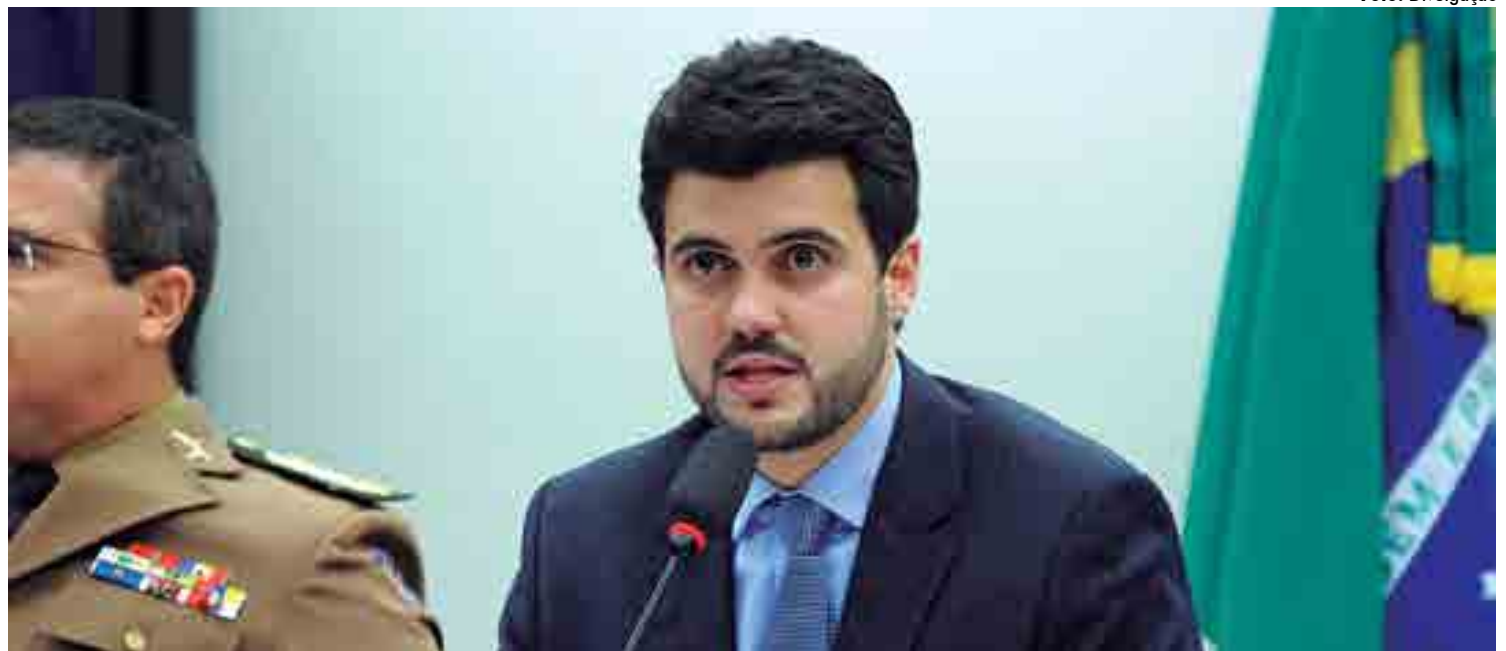
PL de autoria do deputado federal Wilson Filho (PTB) tramita em caráter conclusivo e será analisado pela Comissão de Viação e Transportes e pela CCJ

A proposta tramita em caráter conclusivo e será analisada pelas comissões de Viação e Transportes; e de Constituição e Justiça e de Cidadania.